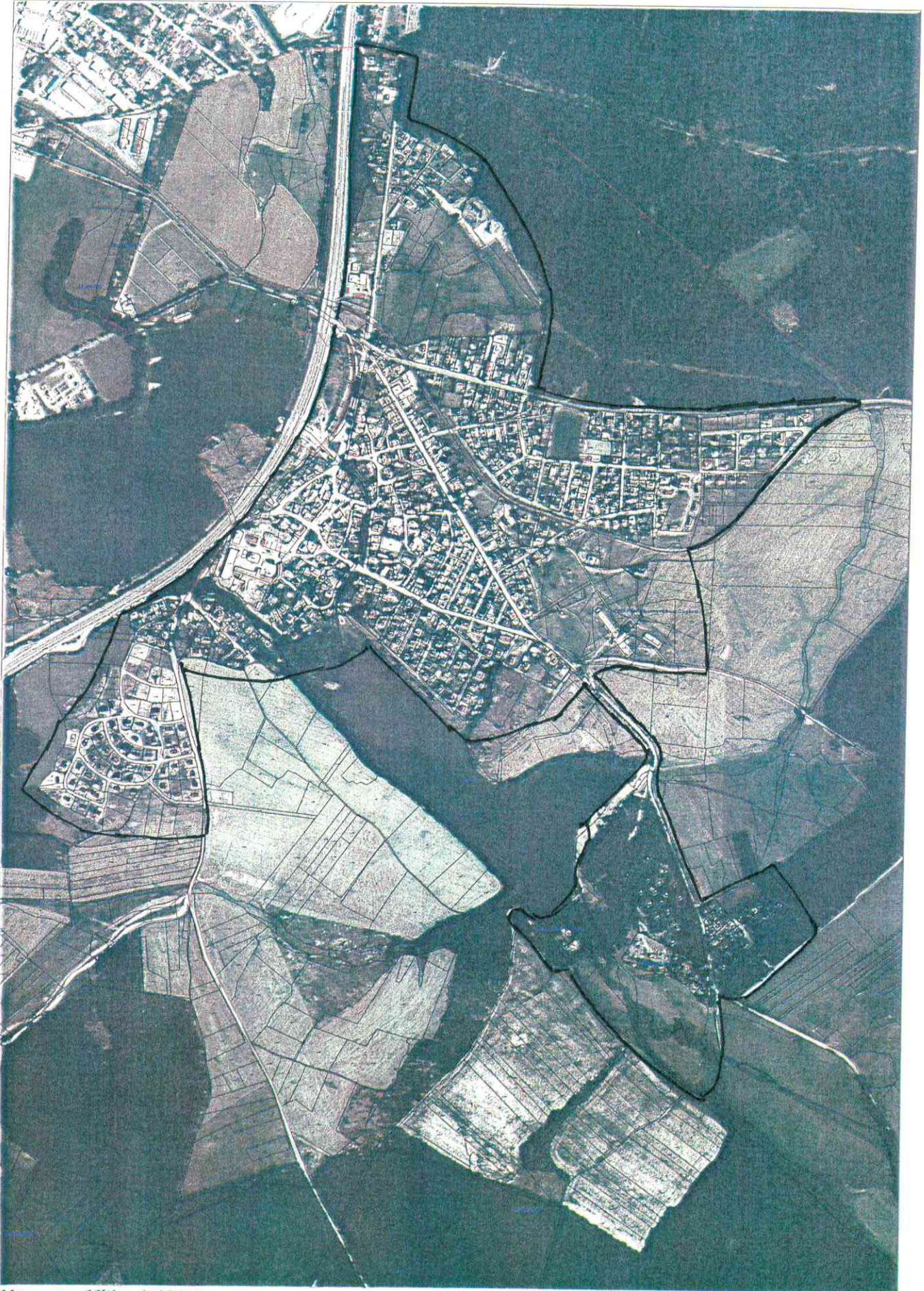
Mapa v měřítku 1:12000